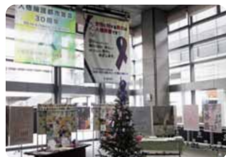
豊中市役所第二庁舎1階ロビーでも関連展示(11/11～11/27)を行います(写真は平成25年度の様子)

DVを防止していくには、男女の人権を尊重し、個人の尊厳を傷つける暴力は許さないという意識を社会全体で共有することが重要だと考えています。