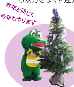
パープルリボンツリーとマチカネくん