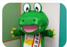
マチカネくん(応援団長)

日本ヨーガ療法学会認定ヨーガ療法士。ケアリングヨーガ療法インストラクター。シヴァナンダヨーガ上級指導者養成コース修了。2009年より関西にてヨーガの普及に努める。すてっぷ登録団体「癒しのヨーガ」講師。現在、川西市勝福寺、豊中国際交流センター、ヨガスタジオタミサ、高齢者施設等で指導中。