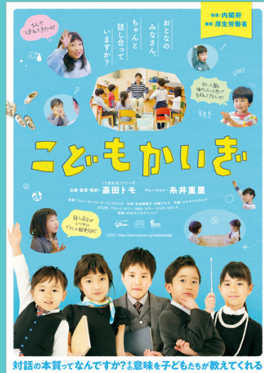
対話の本質ってなんでですか?と意味を子どもたちが教えてくれる