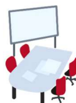
貸ホール 貸会議室