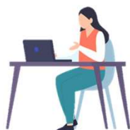
就労支援スペース 「すてっぷα」