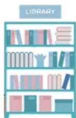
情報ライブラリー