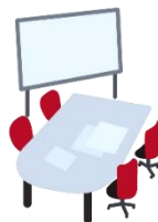
貸ホール 貸会議室