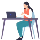
就労支援スペース 「すてっぷα」