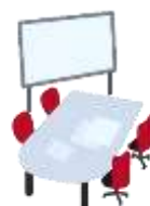
貸ホール 貸会議室