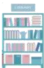
情報ライブラリー