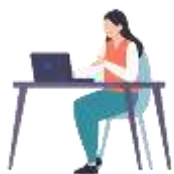
就労支援スペース 「すてっぷα」