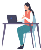
就労をめざすスペース 「すてっぴa」