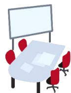
貸ホール 貸会議室