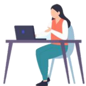
就労支援スペース 「すてっぷα」