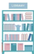
情報ライブラリー